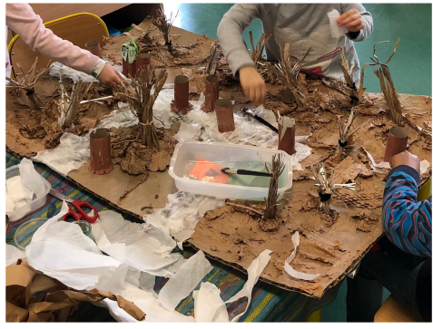
Travail avec le carton