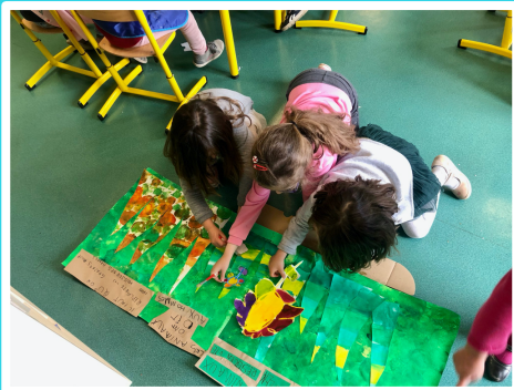
Réalisation de la forêt (peinture et collage)