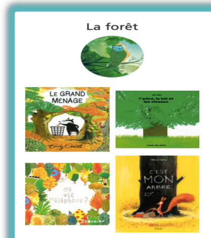
La sélection des albums.

- Lecture d'un autre album : Dans la forêt du paresseux de L. RIGAUD et S. STRADY, très visuel, car la forêt disparaît petit à petit au fil de la lecture. L'album se termine tout de même sur une note d'espoir car un homme vient planter des graines pour faire pousser une nouvelle forêt pour le paresseux.