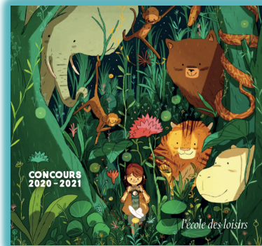
L'affiche du concours

Les élèves de MS/GS de l'école maternelle Mme de SEVIGNE ont participé au concours de l'Ecole des Loisirs afin de réaliser une création en volume inspirée d'une sélection de livres et à partir de matériaux de récupération : ils ont choisi le thème de la forêt.